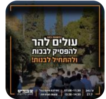
19 - 25 تموز/يوليو 2023