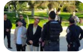
19 - 25 كانون الأول/ديسمبر 2018