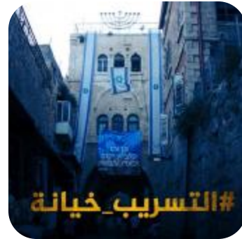
24 - 30 تشرين الأول/أكتوبر 2018