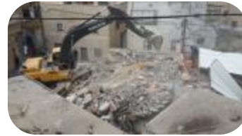
27 أيار/مايو - 02 حزيران/يونيو 2020